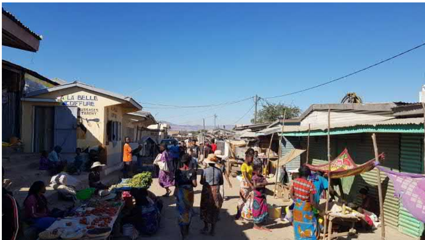
ABITATO DI ANKAZOABO