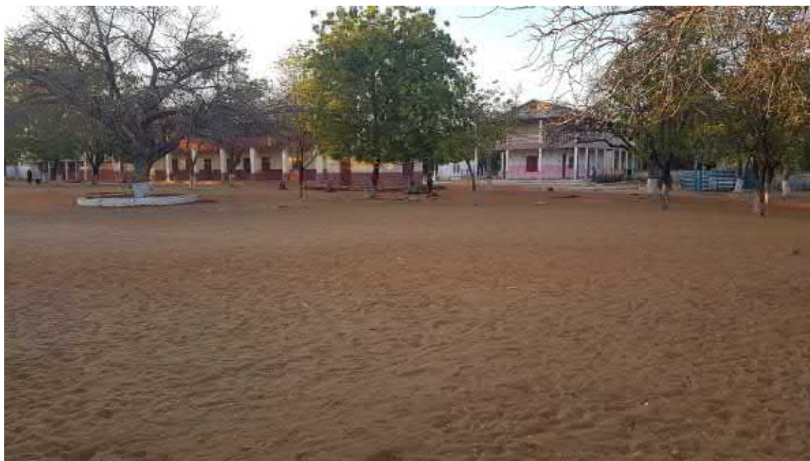
MISSIONE DI ANKAZOABO SCUOLA E CASA DELLE SUORE ORIONISTE