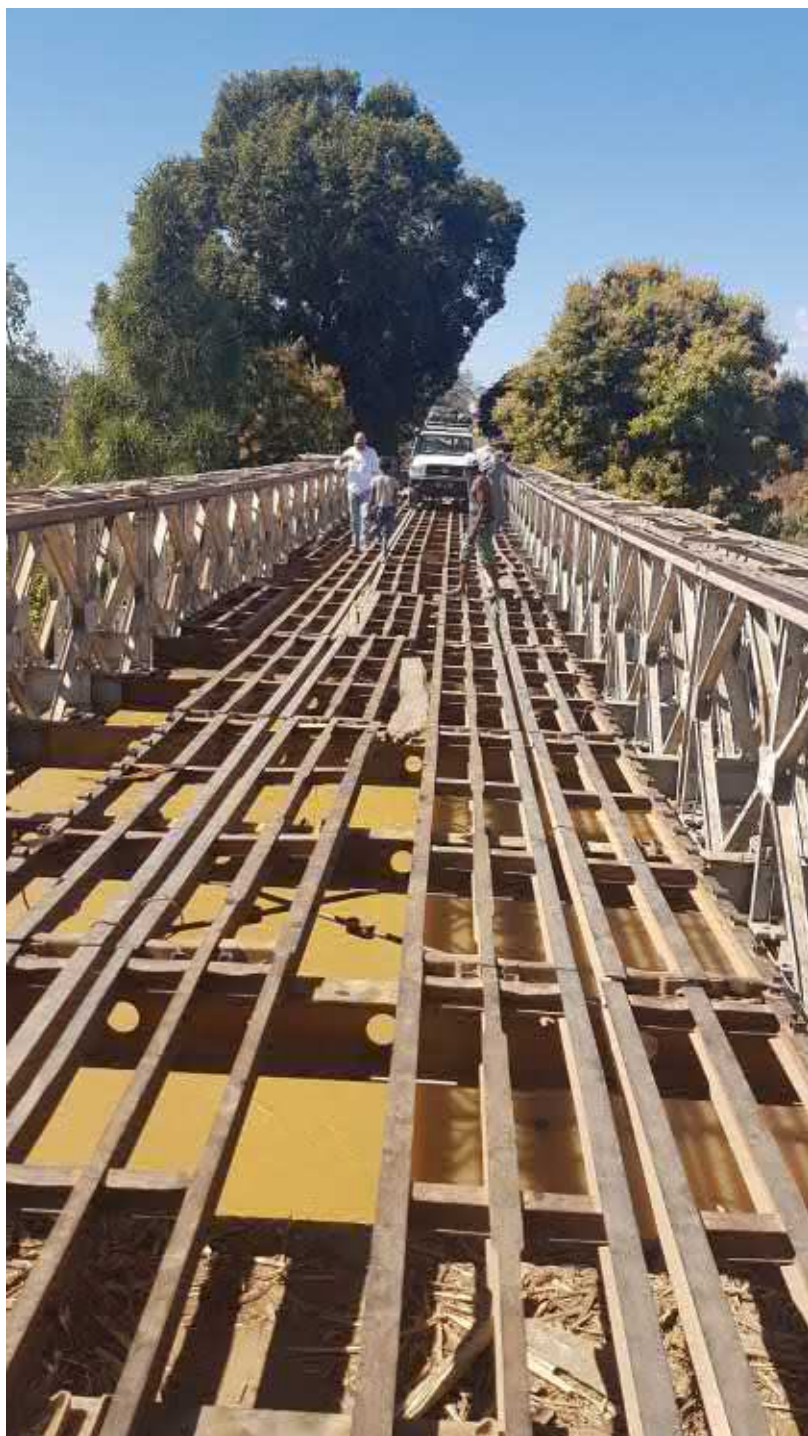
IMMAGINE SIMBOLO DELLA DIFFICOLTÀ DEI TRASPORTI IN MADAGASCAR